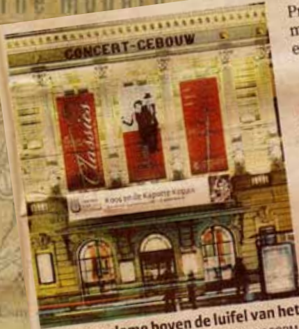
De lichtreclame boven de luifel van het Concertgebouw.