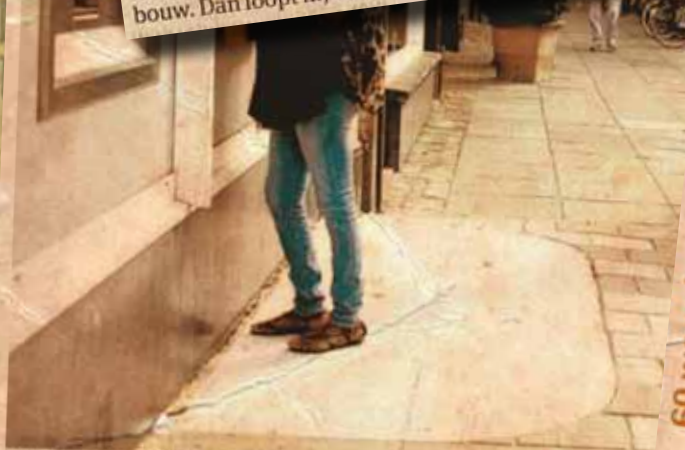
Geldautomaat in de De Pijp met een zogeheten 'safety spot reflex zone'.

Wanneer ik er donderdagavond laat langs fiets, speelt een filmpje met een orkest dat een bekend muziekstuk door de verlaten straat doet klinken. Het miezert. Een wandelaar met opgetrokken schouders stopt en heft zijn armen boven zijn hoofd. Met wilde gebaren maakt hij zichzelf even de dirigent die de lichtbak aanstuurt. Alleen hij en het immense rijksmonument. De koning van het Concertgebouw. Dan loopt hij weer verder.