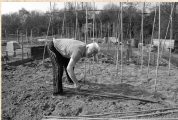
Muzaffer Ozdenir is begonnen met een moestuin omdat hij zo was aangekomen en is nu al jaren met plezier bezig.