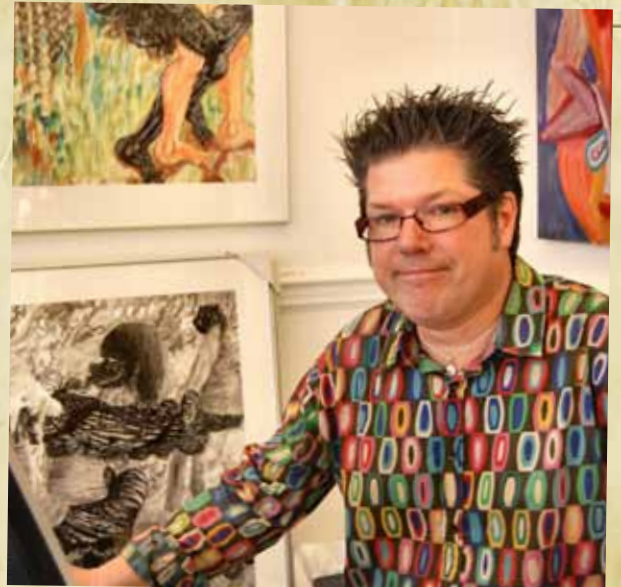
5 JAAR AMSTERDAM OUTSIDER ART