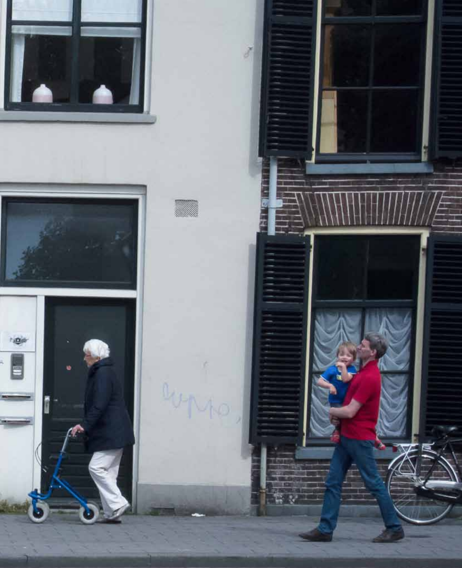
Thijs Mosterman is fotograaf in wording. Hij wil de dingen graag op een andere manier laten zien: zoals ze ook zijn, maar in de regel nooit worden bekeken.