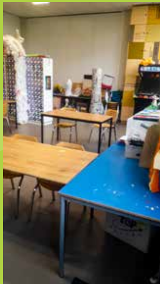
HET CKV- LOKAAL